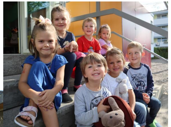
Neue kleine Kindergartenkinder und 4. Klasse Weiden